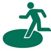
洪水時一時緊急避難施設

洪水による浸水から身体を守るため、 浸水が解消し、 地上を安全に歩行ができるまで、 一時的に避難 するための建物